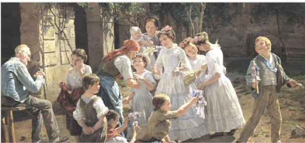
La mattina del Corpus Domini

Questa celebrazione è molto cara ai Cristiani. Per invitarvi a capirla e a viverla, vi propongo alcuni insegnamenti di quel libro mirabile che è il Compendio del Catechismo della Chiesa Cattolica.