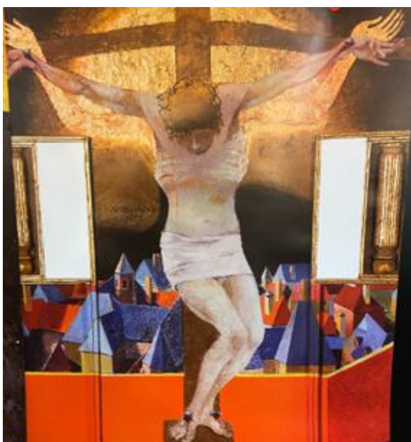
Crocifissione su un villaggio