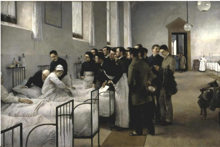
Un reparto ospedaliero durante il giro del primario

“Al mattino presto si alzò quando era ancora buio e, uscito, si ritirò in un luogo deserto, e là pregava. Ma Simone e quelli che erano con Lui si misero sulle sue tracce. Lo trovarono e gli dissero: “Tutti ti cercano!”. Marco 1, 29-39