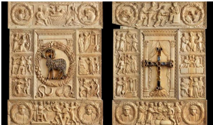
Copertura in avorio dell'Evangelario fine V secolo - Museo Duomo di Milano

Ecco la prima chiamata, ecco i primi discepoli, e questi rispondono “subito”. Vorrei con voi riflettere su questo avverbio